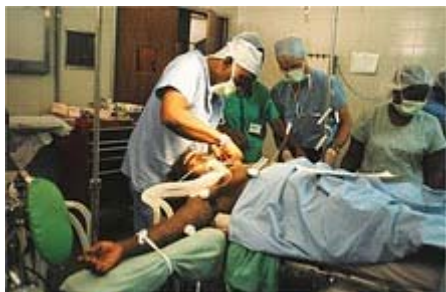
Operation am Hôpital Albert Schweitzer

Am 17. Januar (Sonntag) fuhr ich dann mit sechs haitianischen und amerikanischen Ärzten als Verstärkung zurück ins Hôpital Albert Schweitzer, sozusagen nach Hause. Welch ein Unterschied zum Albtraum in Port-au-Prince! Zwar lagen in den Gängen, Zimmern, Büros, draussen in der Kinderklinik und beim Empfang hunderte von Verletzten wie natürlich noch nie, ausser in den letzten Tagen, wo offenbar nochmals so viele da waren. Ich kann mir zwar nicht vorstellen, wo dann noch Menschen untergebracht wurden. Aber viele wurden offenbar bereits operiert und wieder nach Hause entlassen. Alle, die noch auf Operationen warteten, hatten Infusionen, Schmerzmittel und die Röntgenbilder. So konnten die mitgebrachten Chirurgen und Orthopäden nach einem kurzen Imbiss sofort mit Operieren beginnen, während damals die meisten Verletzten in Port-au-Prince noch unversorgt irgendwo draussen, gelegentlich notdürftig durch eine Plane geschützt, in Parks und Gärten so wie auf der Strasse lagen, teilweise mit bereits eiternden offenen Frakturen.